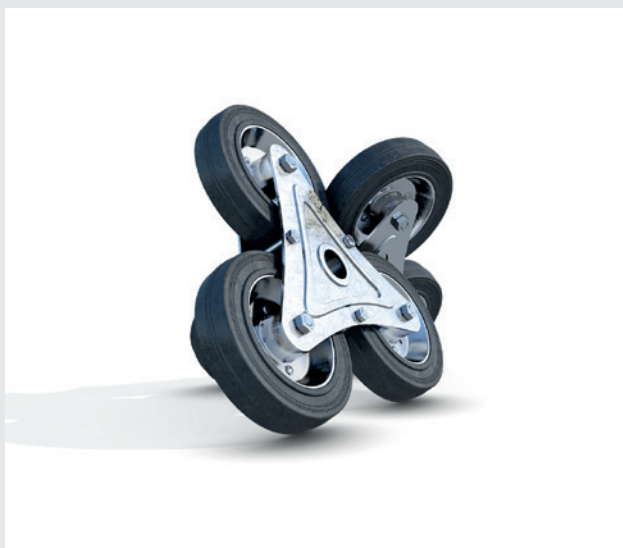
Modulo tripla ruota