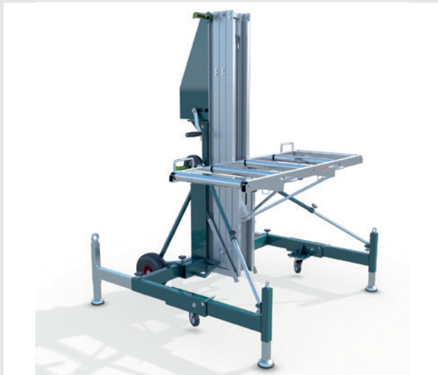
LIGHT MAXIMUM STABILIZZATO