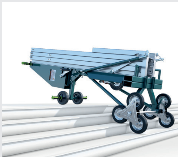
Light in modalità trasporto