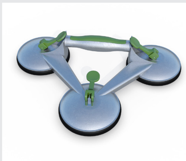
A PLACCA TRIPLA

Ideali per la movimentazione ergonomica e in sicurezza di lastre di marmo liscio, vetro e laminati plastici. Sono disponibili in due versioni: a placca singola con manopola per la regolazione del vuoto e indicatore di vuotometro oppure a tripla placca con leve di attivazione e disattivazione del vuoto .