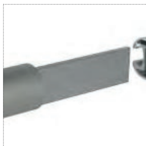
Binario e giunzione