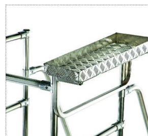
Vaschetta porta oggetti