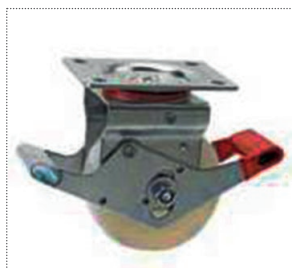
Ruote disassate con freno