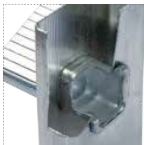
Doppio bloccaggio idraulico