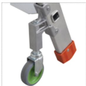
Ruote anteriori Ø 80 mm