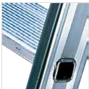
Gradino 85 mm