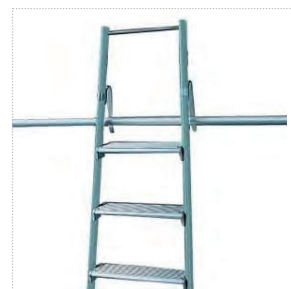
Scala a riposo