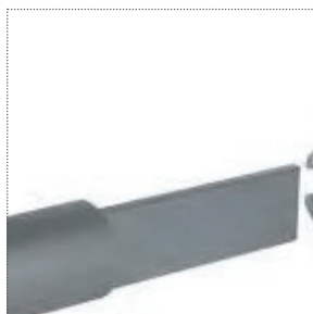
Binario e giunzione