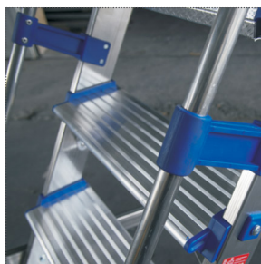
Corrimano in alluminio e PVC