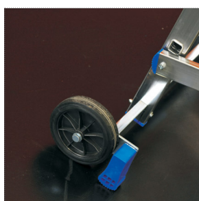
Base con ruote diametro mm 175