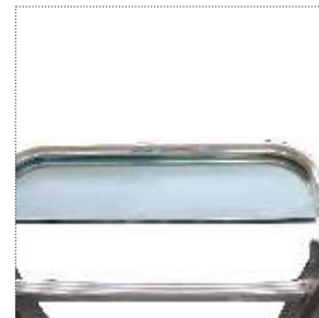
Portaoggetti in acciaio mm 500 x 150