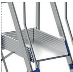
Piattaforma di lavoro 760 x 440 mm