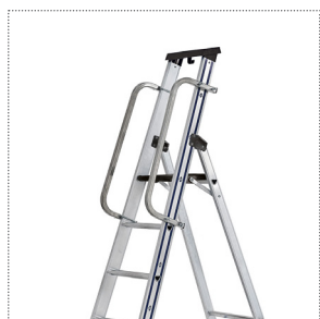
Corrimano in tubo quadro di alluminio