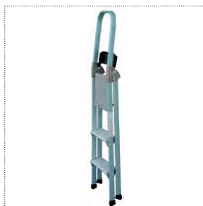
Scala a riposo