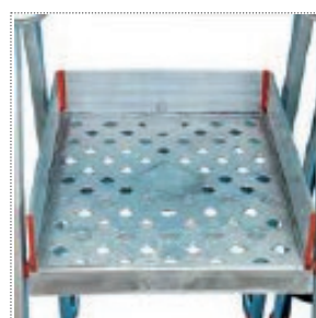
Pedana pieghevole con fori di pulizia (40,5x51)