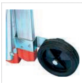
Ruote inattive Ø 150 mm con supporti d'acciaio