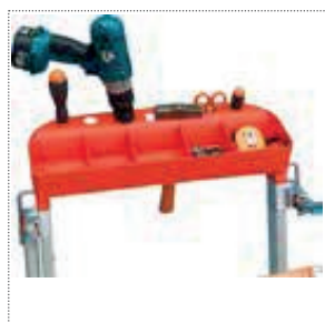
Vaschetta porta oggetti ampia (10 kg portata)