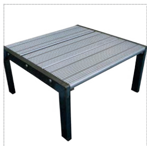
Sgabello a un gradino