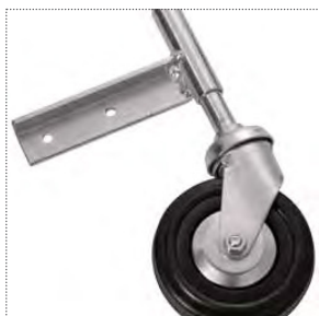
Kit porta ruota