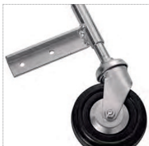
Kit porta ruota