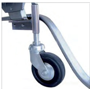
Particolare attacco e ruota piroettante

SU RICHIESTA LA SCALA PUÒ ESSERE SPEDITA MONTATA