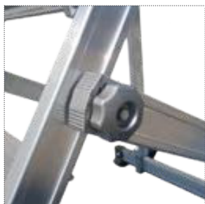
Volantino di chiusura scala