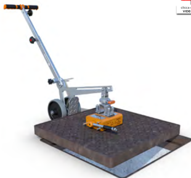
Carrello Simplex Magnetic